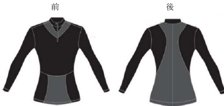
図1：パワーメッシュを使用している部位（グレー部分）

素材は、吸汗速乾性・伸縮性に優れた柔らかく着心地の良い『テクノタッチ ※2 』を採用し、年間を通じて着用できるウエアです。