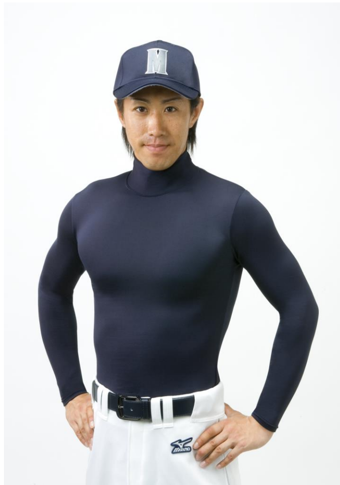
野球用アンダーウェア「バイオギア WDモデル」

※「バイオギア」は、運動生理学やバイオメカニクスの研究に基づいて、素材のストレッチや衣服圧をコントロールすることにより、身体のバランスを整えスポーツ時のパフォーマンスの向上や、筋肉・関節へのサポート機能を持たせた商品群の総称です。野球・ゴルフ・トレーニングなどあらゆる競技で水平展開しています。