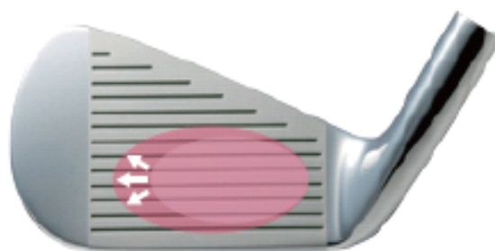
図6：ワイドなスイートエリア