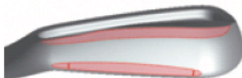
図5：トリプルカットソール

また、キャビティ部分のウエイト配分により、スイートエリアをトゥ方向に拡大しました。打点が多少ばらついていても安定した方向性を発揮し、飛距離のロスを軽減することが可能です。