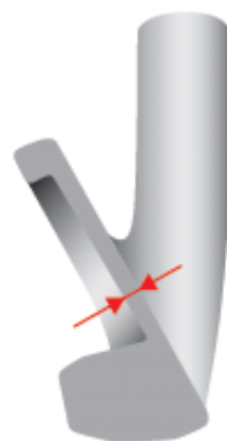
図3：フェース部の薄肉化

「JPX 800FORGED」アイアンは、打感の良い「ミズノ MP」シリーズで使用している独自の軟鉄素材『S25CM』を採用しながら、フェース部分を薄肉化（図3）して、反発性能を向上させました。これにより軟鉄鍛造ならではのやわらかい打感をいかしながらも飛距離アップを追求しました。