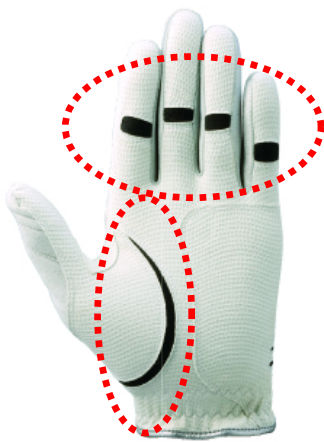
※1 ストレッチ素材配置部分

「指先ショート」タイプは、標準サイズに比べ各指先の長さを7～8mm短くしています。フィット感を高めるために、親指付け根部分・他指4本の第二関節部に最大5mm伸びるストレッチ素材を配置(※1 写真)した『指ストレッチ構造』を搭載、「標準サイズ」の手袋では指先までフィットしないようなゴルファーにも対応しています。これにより「ミズノ バイオロック プラス T (ティ-)」は「標準サイズ」タイプ、「指先ショート」タイプを合わせ、約75%のゴルファーをサポートします。(※2 グラフ/ミズノ調べ)