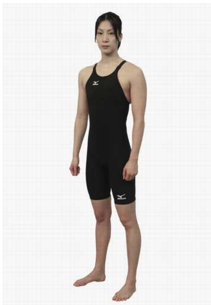
「ミズノ GX」ハーフスーツ¥30,450 (税込) カラー：ブラック モデル：寺川綾選手 (ミズノスイムチーム)