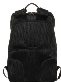
バッグの背当て面