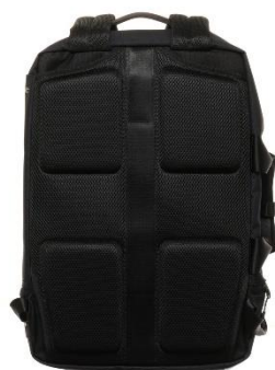
バッグの背当て面