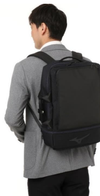
画像：エアロ 3WAY ビズバッグ

『エアロ 3WAY ビズバッグ』では、背当て面の4箇所にパッドを装着することで上下・左右に通気路を確保し、背中の蒸れを軽減します。また、「バックパック」と「手提げ」に加えて、付属のキャリーケース用ストラップを取り付けることで「キャリーオンバッグ」としても使用できる3WAY仕様となっています。