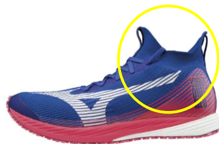
ハイカットのニットアッパー

また、かかと部を支えるカウンターパーツ（芯材）を入れずにフィット感を高めることができるため、ローカットのモデル「WAVE DUEL NEO Low」と比べ、約10gの軽量化を実現しました。