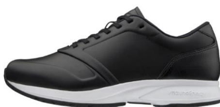
「ME-02（エムイーゼロニ）」 ¥15,400（本体価格¥14,000）

■「ME-01」「ME-02」シリーズ特設サイトはこちら https://www.mizuno.jp/walking/mizuno-energy/