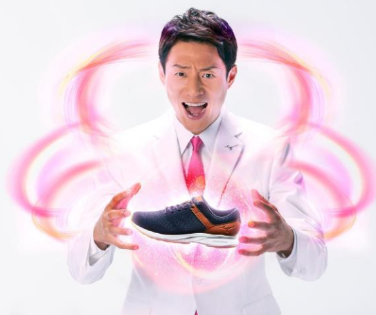
ミズノブランドアンバサダー松岡修造氏