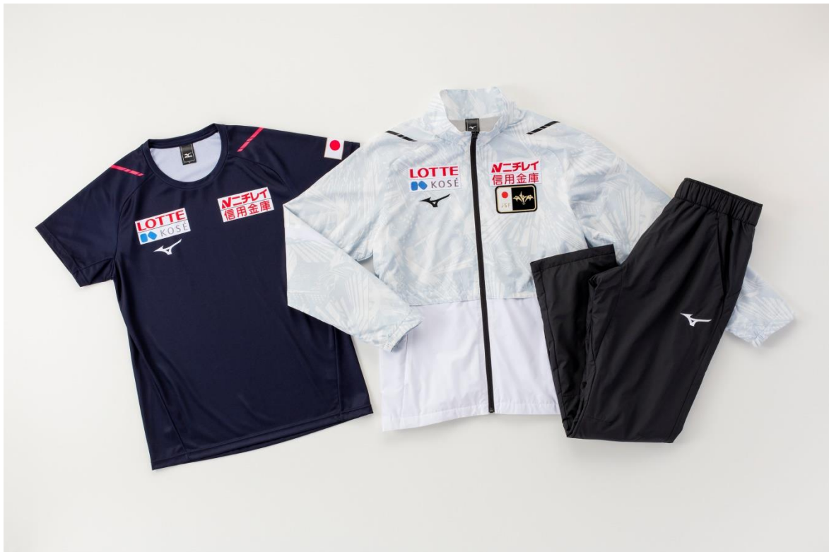
スケート日本代表オフィシャルウェア（ウォームアップ用シャツ、パンツ）

また、日本代表選手が着用するオフィシャルウェアのベースモデルを、ミズノ公式オンラインショップ、全国のミズノ品取扱店で販売中です。