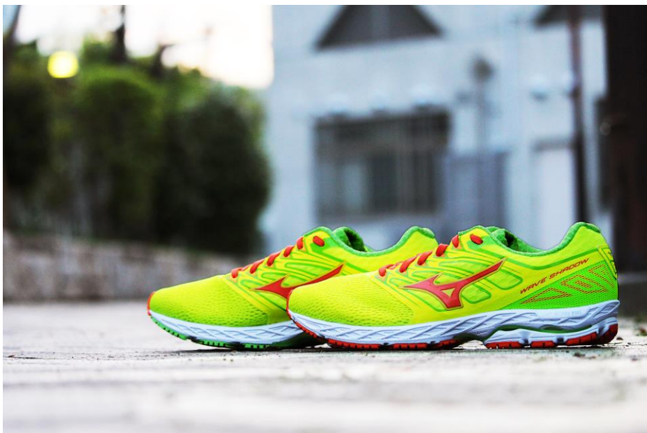
ランニングシューズ「WAVE SHADOW」

国内販売目標は20,000足です。またアメリカ、ヨーロッパに加え、アジア地域でも一部販売する予定で、グローバルでの販売目標は123,000足です（数字は共に発売から1年間）。