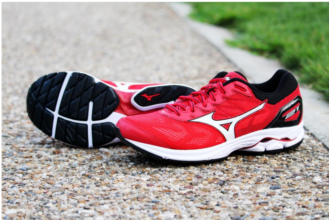
ランニングシューズ「WAVE RIDER 21」