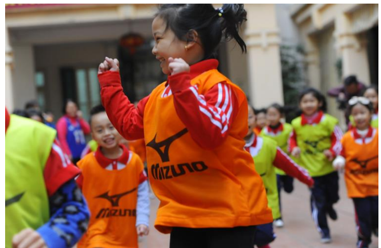
運動プログラム「ヘキサスロン」 (ベトナム国内でのデモ授業の様様/2017年1月撮影)