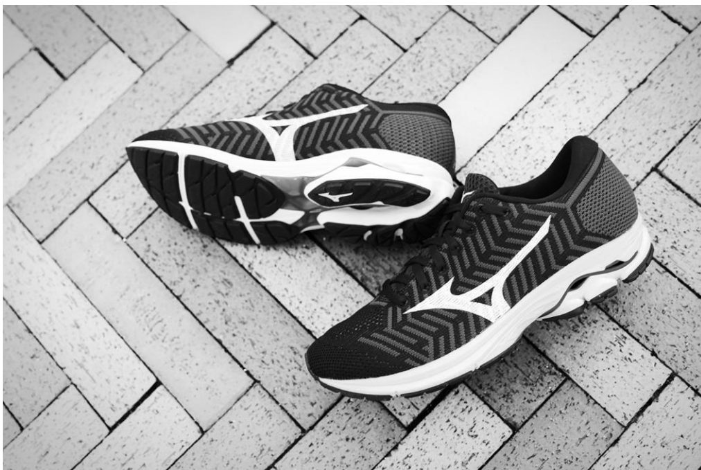
ランニングシューズ「WAVEKNIT R1」

尚、ミズノがニットアッパーのランニングシューズを発売するのは今回が初めてで、世界統一モデルとして販売します。グローバルでの販売目標は46,000足、国内販売目標は5,500足です（数字は共に発売から半年間）。