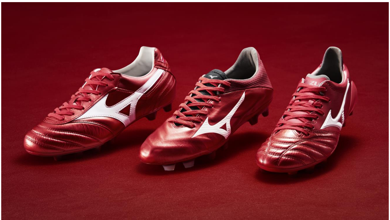
左：「MORELIA II」（¥18,000+税）、中央：「REBULA 2 V1 JAPAN」（¥25,000+税）、 右：「MORELIA NEO II」（¥20,000+税）

「REBULA 2」（PASSION RED カラーを含む）の国内販売目標は、シリーズ全体 30 万足です（発売から1年間）。「MORELIA II」「MORELIA NEO II」の PASSION RED カラーは、それぞれ限定 5,000 足販売予定です（国内）。