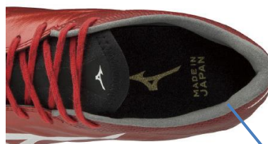
スウェード調の素材