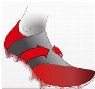
『タングバンド構造』

「REBULA 2」では、シュータン部分にバンド構造を採用し、履き口に足当たりの良いスウェード調の素材を使用することで、フィット感をさらに向上させました。