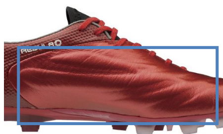
新しい『CT フレーム』設計