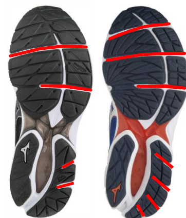
『WAVE RIDER 21』

「WAVE RIDER 22」は、前回モデルのソール部全体に比べ、フレックスグループ(屈曲溝)の数を4本から7本に増やしました。地面へのより滑らかな着地から蹴り出しまでの屈曲性を高めることで、スムーズな体重移動を追求しています。