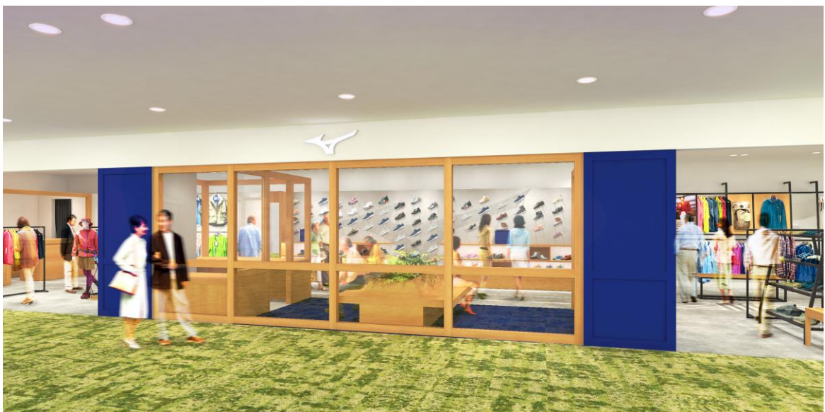
「ミズノウエルネスショップなんばスカイオ」（イメージ）

※2・・・（株）アド南海ホームページ http://www.adnankai.co.jp/appeal/nankai_passengers.html