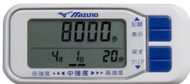
活動量計「M77（エムナナナ）」

※4・・・群馬県中之条町にすむ65歳以上の全住民5000人を対象に15年以上にわたり身体活動と病気予防の関係について調査した研究