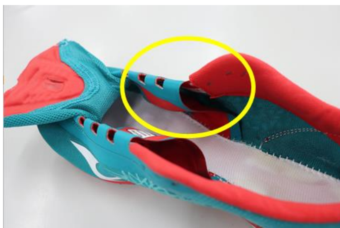
アッパー内部のバンド構造

アッパー内部に、足を包み込むようなバンド構造を採用。ホールド性がアップしたことで、スピードに乗った状態での足ずれ軽減を実現しました。