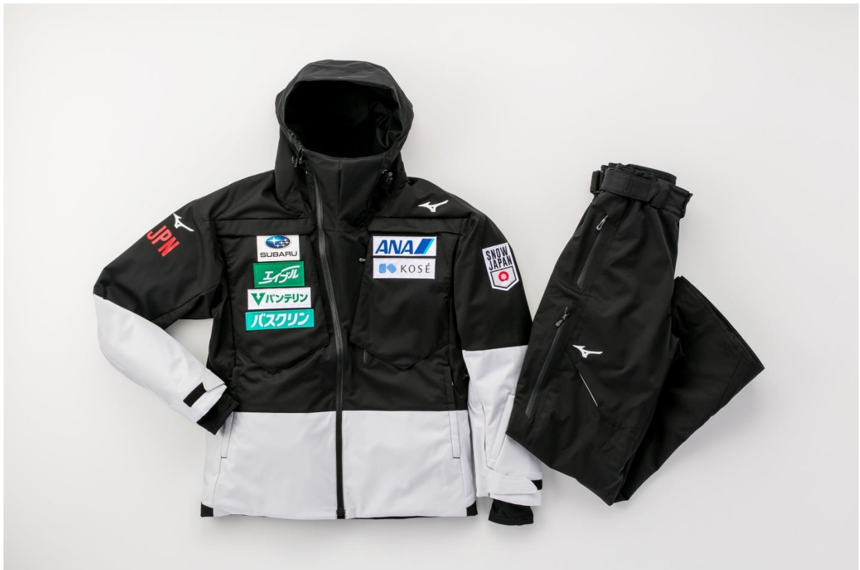
“SNOW JAPAN” オフィシャルウェア（スキージャケット、パンツ）

日本代表の小林陵侑選手、高梨沙羅選手、渡部暁斗選手などが国際大会で着用予定です。