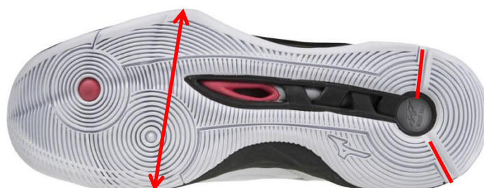
前足部は幅広な設計

またジャンプ時にはヒールの丸みと、二本の溝により屈曲性が高まり、ジャンプ直前のスムーズな踏み込み動作をサポートする設計となっています。