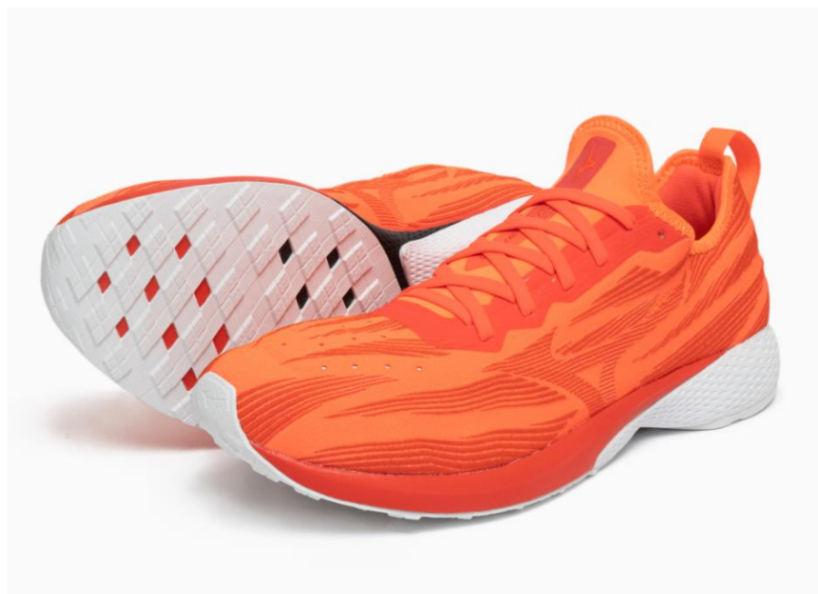
「WAVE AERO 19(ウエーブエアロナインティーン)」

*2 %は従来のソール素材(U4ic)と材料性能のみについて比較したもので、製品性能は設計等により効果や感じ方が異なります。(自社比。向上度合いを示し、生産上、数値はばらつくことがあります。反発性は鉛直方向に圧縮した場合の比較です。)