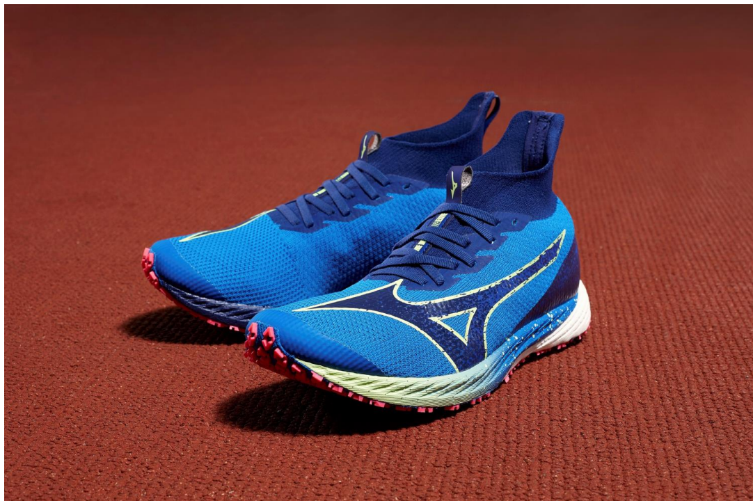
ランニングシューズ「WAVE DUEL NEO 2 ELITE」 ¥25,300（本体価格 ¥23,000）

アッパーがローカットのモデル「WAVE DUEL NEO 2」も同時に発売します。販売目標はグローバルで「WAVE DUEL」シリーズ全体2万4千足です（発売から1年間）。