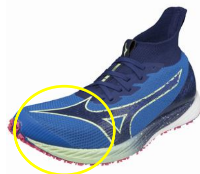
軽量ニットアッパー

アッパー部の糸の編成を減らし網目を広げることで、通気性の向上と軽量化を追求し、前モデルより約 10g 軽い約 185 g (27.0cm 片方) を実現しました。また、シュータンやかかと部の設計も見直すことで、さらなるフィット感の良さを追求しました。