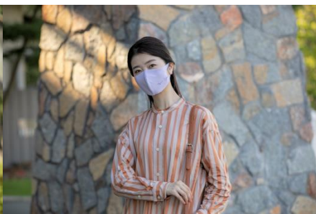
ライトラベンダー