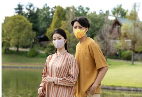
左：ベージュ、右イエロー