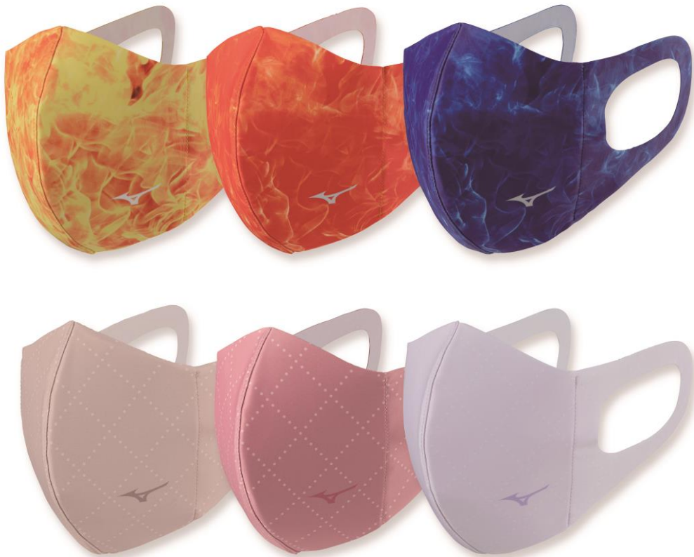
「ミズノマウスカバー」上：炎柄 下：ダイヤモンドチェック柄

今後も継続して様々なデザインの「ミズノマウスカバー」を展開していく予定です。「ミズノマウスカバー（炎柄・ダイヤモンドチェック柄）」の販売数量は、限定14,000枚です。