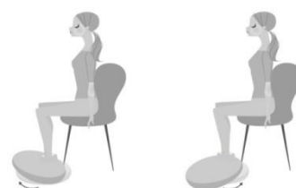
足首の曲げ伸ばし動作