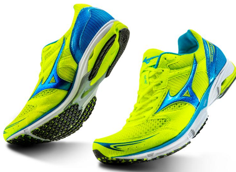
ランニングシューズ「WAVE EMPEROR」¥13,900+税（税込価格:¥15,012）

一般ランナーの中でもフルマラソンを3時間前後で走り、トップ層とエントリー層の間に位置するスピードランナーに向けた戦略モデルとして2015年12月から展開しています。