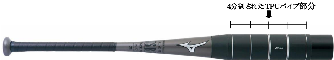
【バットスイングロボットによる打撃直後のボール初速テスト単位 m/s】 (株式会社 テクニクス調べ)

しっかりとした打感にするため、打球部は柔らかい素材と硬い素材を重ねた構造にしています。その上で、打球部のウレタン素材の柔らかさが引き出せるように、表面を覆う硬い素材は4分割にしています。これによりしっかりとした打感は追求しながらも、ボールの変形をおさえ、飛距離も従来どおりです。