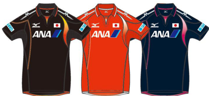
<男子ゲームシャツ>