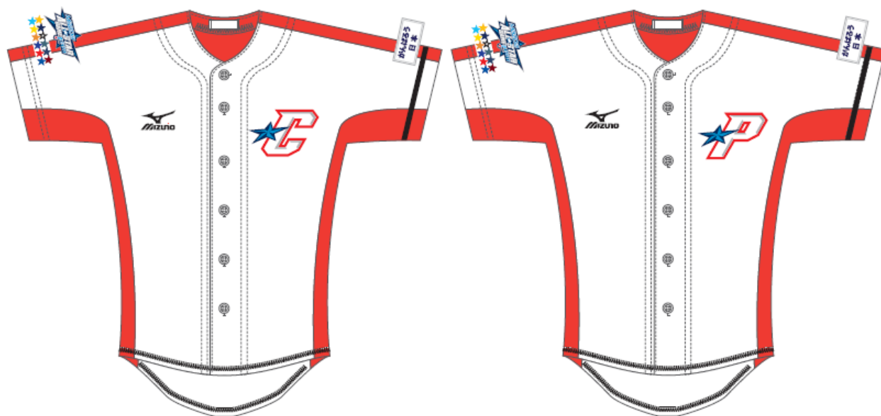
「マツダオールスターゲーム プラクティスユニフォーム」