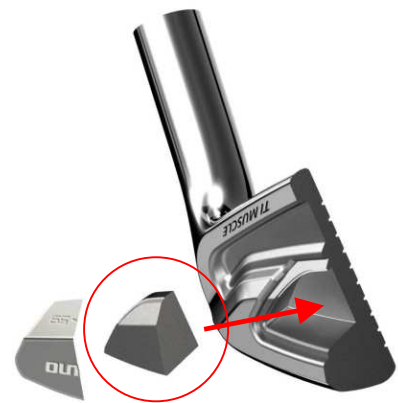
図1：圧入しているチタンパーツのイメージ

また精密なチタン圧入技術によって、本体とチタンパーツの密着性を高めることにより、前作よりも打撃時のヘッドの音の響きが長くなり、心地よい打感を追求しています（下図2）