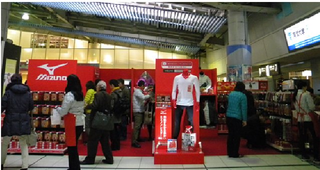
JR 品川駅構内での出店

ミズノでは、11月28日(月)～12月4日(日)の7日間、吸湿発熱素材「ミズノ ブレスサーモ」専用ショップをJR品川駅構内に出店。ブレスサーモの更なる認知度向上のために、ショップ周辺で原綿体感キットを使った発熱体感イベントも実施しました。