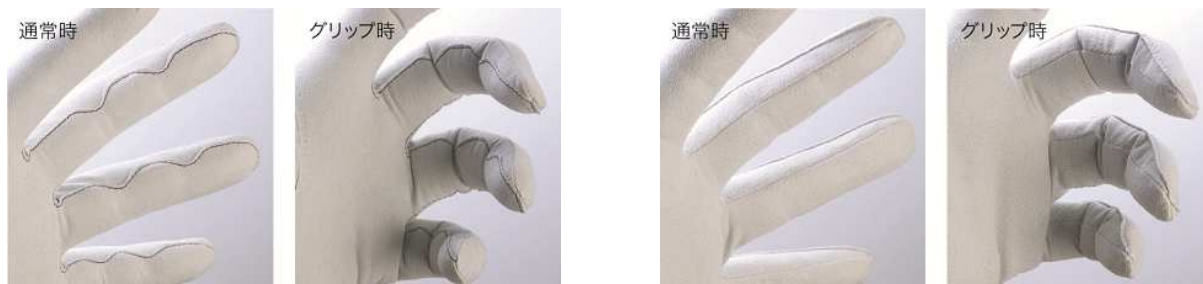
「コンフォートフィット構造」採用品

手の平側には天然皮革を使用し、ミズノ独自の生地縫製とカッティング技術である 「コンフォートフィット構造」(下図2)によって、指とグリップの間に縫い目が 当たりにくくなり、ごわつき感を軽減しています。