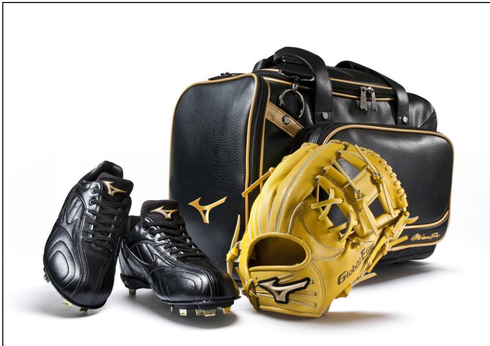
〈ランバード〉を使用した野球品 (硬式グラブ、スパイク、バッグ)