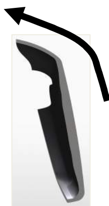
図1：クラウン方向へチタン部分を伸ばしたフェースの断面図

さらにカップフェースをクラウン側へ従来品より2倍の長さに伸ばすことで（下図1）、反発の高いエリアを上方向へ広げました。この結果スイートエリアは従来品に比べ上方向に拡がり（図2）、フェース上部でボールを打った場合でも飛距離のロスを抑制し打ちやすくなっています。