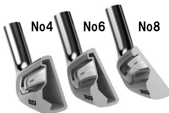
図3：フェース面を薄肉化した高反発ヘッド設計

フェース面は従来品よりも肉厚を薄くすることによって反発性能を向上させています（右図3）。またヘッドサイズも従来のMPシリーズに比べて大きくし、構えたときの安心感とともに、スイートエリアも拡大しているため打ちやすくなっています。