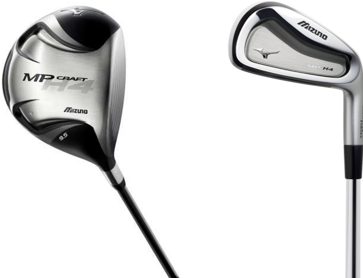
「ミズノ MP H4」シリーズ

「ミズノ MP」シリーズは、昨年史上初の欧・米ツアー賞金王を獲得したミズノプロスタッフのルーク・ドナルド選手（イギリス）をはじめ、国内外の多くのプロや上級者に支持されています。2011年度の「ミズノ MP」シリーズのアイアンは対昨年度比で150%を超える販売数で、今年度も引き続き好調です。ミズノでは、打ちやすさを重視した「ミズノ MP H4」シリーズの投入で、ユーザーの拡大と市場でのシェアアップを図ります。