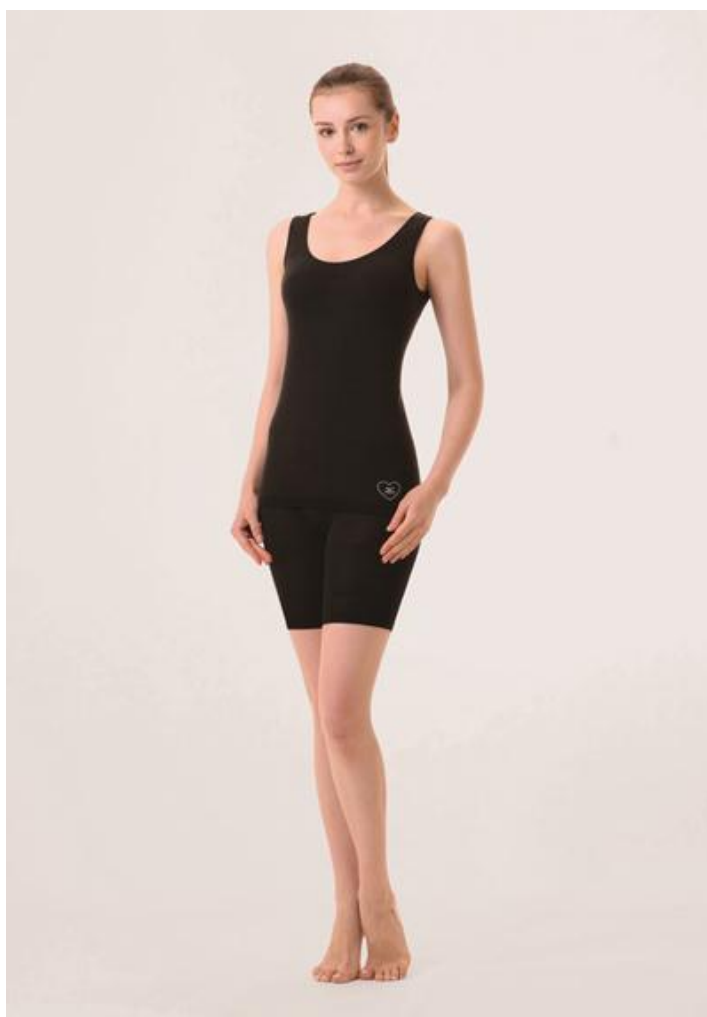
「女子のブレスサーモ」

ミズノ公式オンラインショップ ( http://www.mizunoshop.net/ )での限定販売となります。先行予約を10月1日より受け付け、10月25日より販売します。