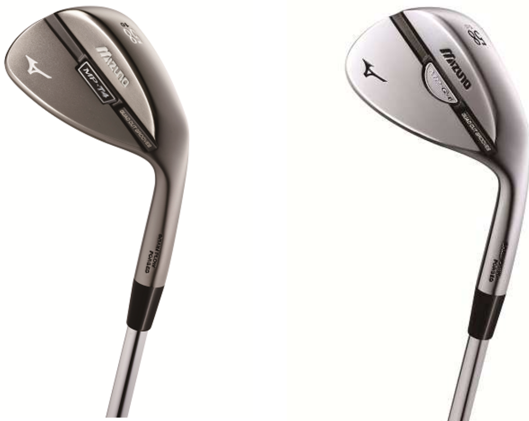
「ミズノMP-T4」ウエッジ (左)、「ミズノMP-G4」ウエッジ (右)

これらのモデルは、バックフェース部分に入れた溝によって重心位置を高くすることで、上下方向の慣性モーメントを拡大しています。これによって前モデルよりもスピン量がアップし、安定した高いスピン性能を発揮します。「ミズノ MP-T4」はスクエアに構えやすいストレートネックのティアドロップ形状で、「ミズノ MP-G4」は日本の芝で高い操作性を発揮するセミグースネックのラウンド形状です。