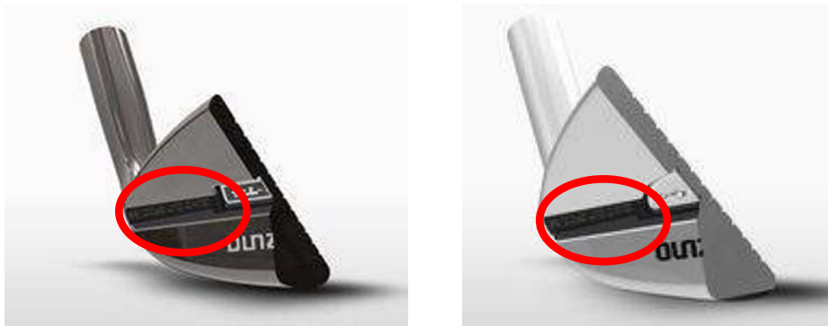
図1：バックフェース部分の溝（赤丸部分 左：MP-T4、右：MP-G4）

「ミズノ MP-T4」、「ミズノ MP-G4」のバックフェースに、トゥ側からヒール側に溝を入れた新しいデザイン（下図1）にすることで重心位置を高くしました。これによって上下方向の慣性モーメントが拡大、前モデルよりもスピン量が6%アップし、安定して高いスピン性能を発揮します。またミズノ独自のロフト別スコアライン設計『クワッドカットグループ』で、フルショット時やアプローチ時など、状況に応じて優れたスピン性能を発揮します。