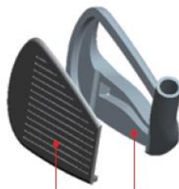
図3：高反発L字カップフェースのイメージ図