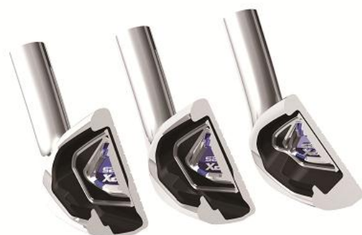
図5：スーパーディープキャビティ構造

またフェースのたわむ範囲を拡大し、反発性能を向上させて飛距離アップを追求しています。