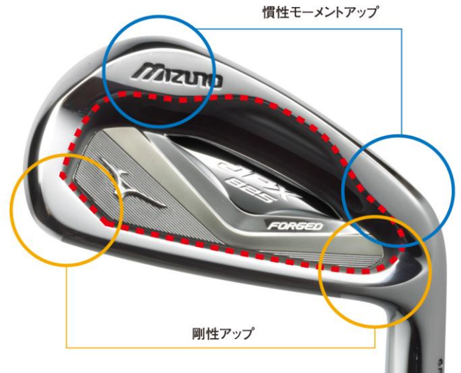
図1：『クリスタルシェイプ構造』の解説図

また『クリスタルシェイプ構造』によって、ヘッド自体のフレーム剛性も向上しているため、薄肉キャビティアイアンでありながらも、インパクト時の余分な振動を抑え、心地良い打感を追求しています。