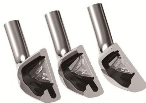
図4：T-SLOTディープキャビティ構造

また前作よりもソール幅を広げ、「T-SLOTディープキャビティ構造」(右図4)にすることで重心深度が深くなりました(No.4～7)。これによって軟鉄鍛造の打感の良さに加え、ボールのつかまりやすさと上がりやすさを向上させています。