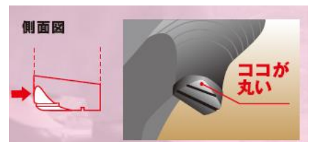
図2 丸みをつけた底面パーツ