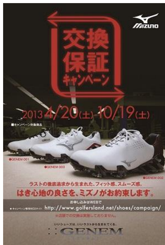
ミズノゴルフシューズ「交換保証キャンペーン」ポスター

ミズノでは、今までの約2万人のゴルファーの蓄積データをもとにフィッティングバリエーションを構築し、サイズに関する検証を実施しました。600名を超えるゴルファーに『GENEM フィッティング』を行った結果、普段誤ったサイズのシューズを履いている人が多く、足幅も人それぞれだということが実証されました。今回の「GENEM」シリーズは3種類のウィズバリエーションと10種類のサイズバリエーション、デザインバリエーションも加えると合計180タイプあります。『GENEM フィッティング』は、正しいシューズ選びのきっかけ作りであり、自分に合ったゴルフシューズ選びをサポートします。さらに、『交換保証キャンペーン』によって、まずはお試しいただくことも可能としました。結果は次ページの通りです。