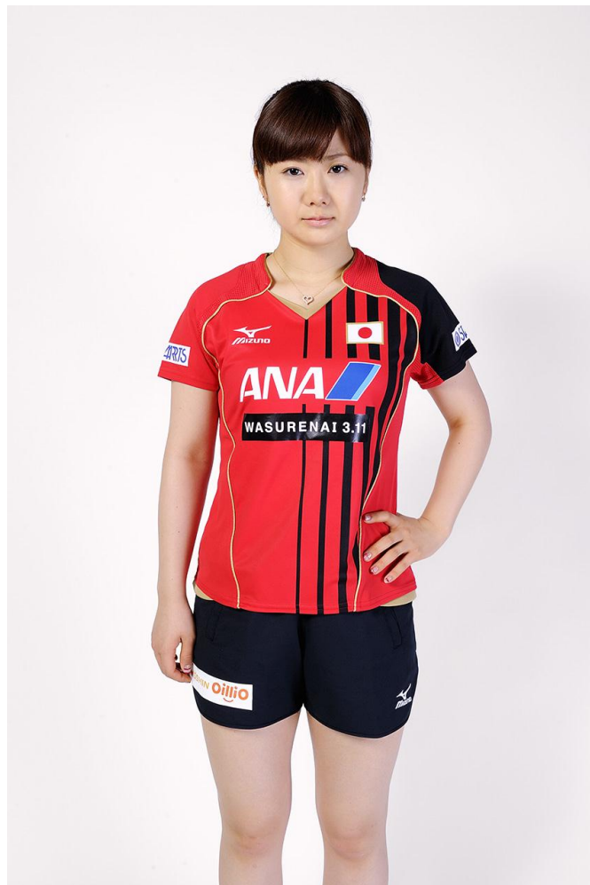
卓球日本代表 オフィシャルユニフォーム (福原愛選手)

デザインテーマは「誇りと挑戦」です。カラーには、選手の競技に対する「情熱」をあらわす「赤」、「強さ」や「不屈の精神」を象徴する「黒」の2色を採用。デザインには、勝利にかける「真っ直ぐな志」と鋭く切り裂く「スマッシュの軌道」をストライプで表現しています。