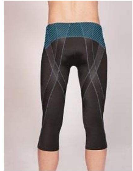
男性用 6 分丈スパッツ

ミズノ独自の動作解析技術を応用し、骨格や筋肉の動きに合わせて設計した骨盤サポート設計を採用しています。締め付けの強いメッシュ素材を腰周りに配置し、骨盤部分を押さえることで体幹を安定させます。(右図 青いライン箇所)