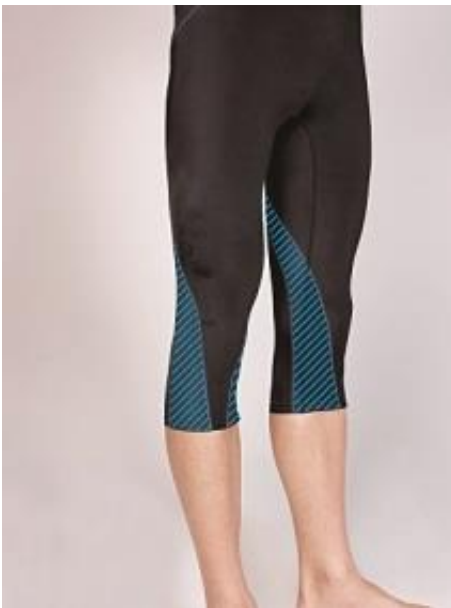
男性用 6 分丈スパッツ

締め付けの強いメッシュ素材をひざの両側に使用することで、ひざをサポートします。(左図 青いライン箇所)