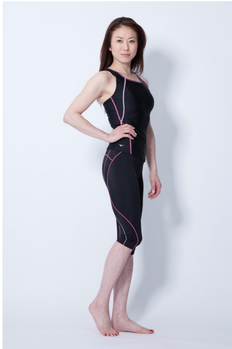
ミズノスイムアンバサダー 田中雅美氏

「BG AQUA」は、コンプレッション系水中ウェアのウォーキング専用モデルとして発売します。骨盤部分や臀部下、ひざ部分に締め付けの強い素材を配置しており、これにより体幹を安定させ、水中での歩行をサポートします。初年度販売目標は2,000枚です。