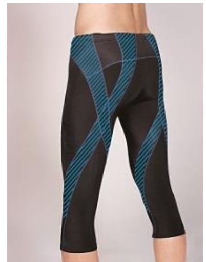
男性用 6 分丈スパッツ

後面に締め付けの強いメッシュ素材を配置することで、ハムストリングスをサポートし、足を振り下ろしやすくします。(右図 青いライン箇所)