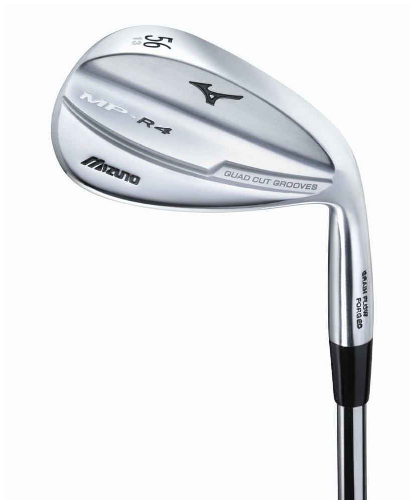
「ミズノ MP-R4」ウエッジ ¥17,850（消費税込み）

これらのモデルは、トップエッジとソールに質量を配分することで、上下方向の慣性モーメントを拡大させています。これにより、打点が上下にばらついた時の、距離とスピン量のばらつきを抑えます。また、ロフト別のソール設計で抜けの良さを発揮し、従来モデルに比べソール幅を拡大することで、打ちやすくなっています。ヘッドは、ラウンド形状にすることでスクエアやオープンに構えても、イメージが変わらないままに構えやすくなっています。