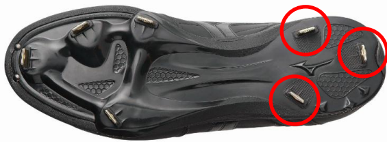
「グローバルエリート PM」