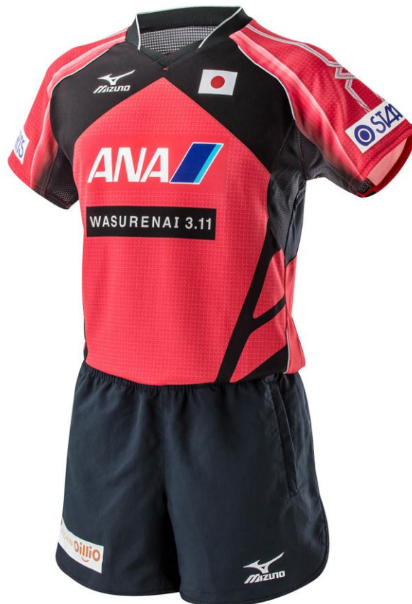
卓球日本代表 オフィシャルユニフォーム

高さ世界一のタワーである「東京スカイツリー®」と同様世界一を目指してもらいたいという希望も込めています。