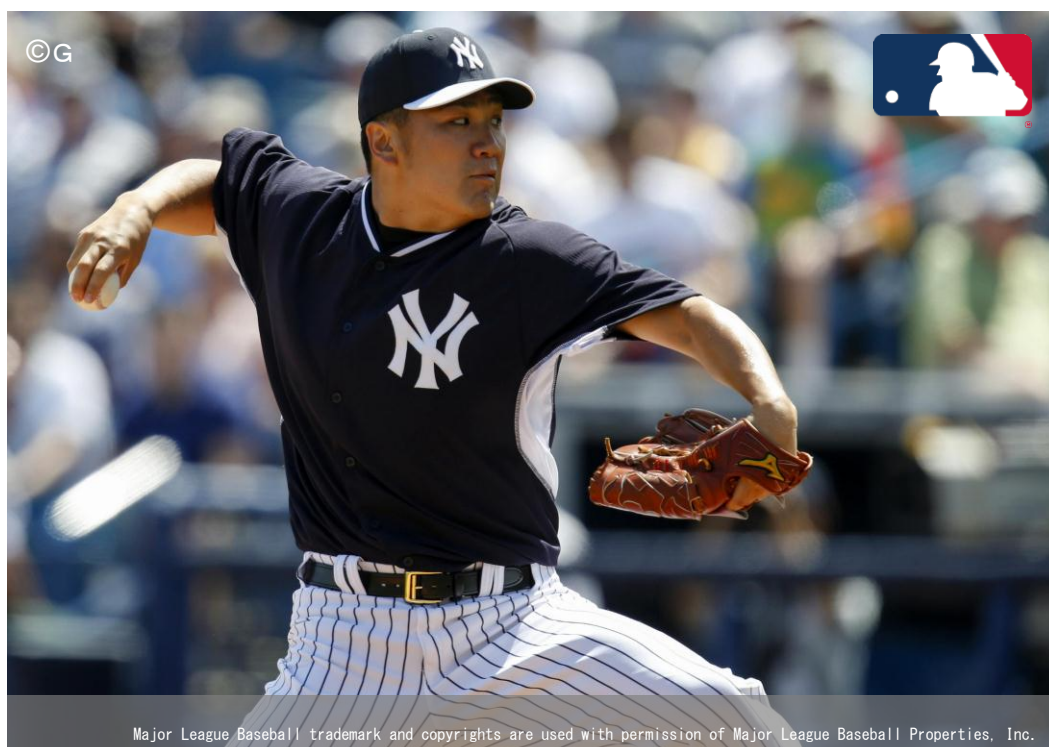
田中将大選手（ニューヨーク・ヤンキース）