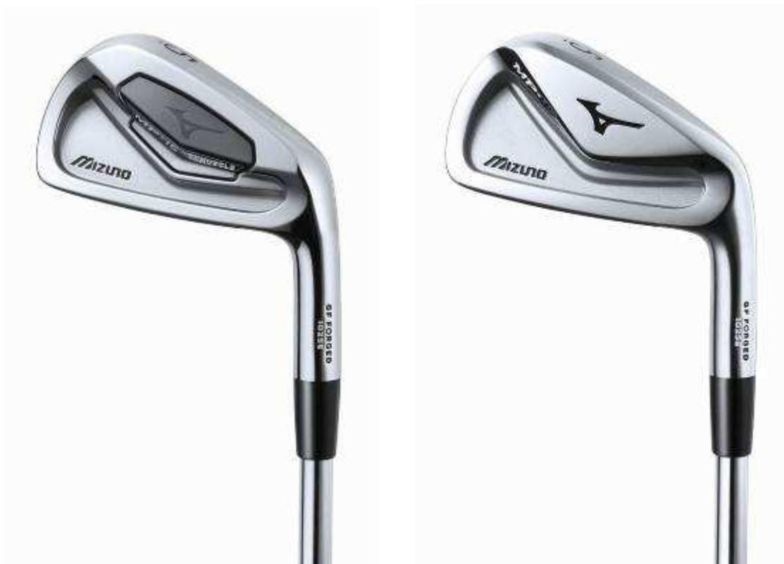
(左)「ミズノ MP-15」アイアン、(右)「ミズノ MP-H5」アイアン アイアン6本組(5~9、PW)ともに ¥114,000+税(税込み価格¥123,120)

2機種とも、機能性による「やさしさ」に加え、ストロングロフトを採用することで「飛び」にも優れています。