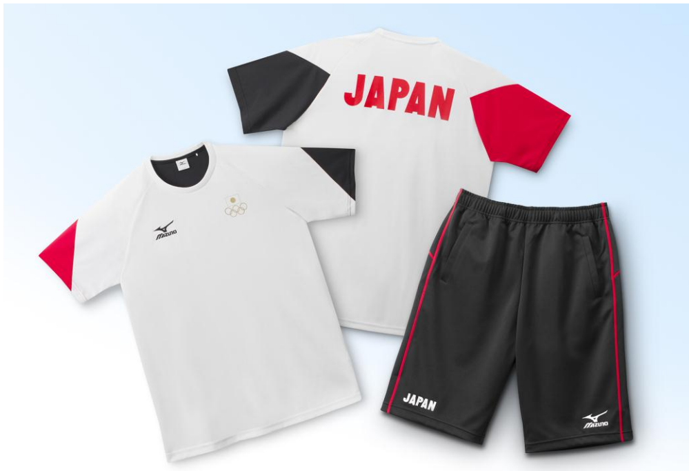
第17回アジア競技大会 日本代表選手団オフィシャルスポーツウエア

なお、日本代表選手団はこのウエアを選手村での生活時に着用します。 オフィシャルスポーツウエアについての詳細は次ページのとおりです。