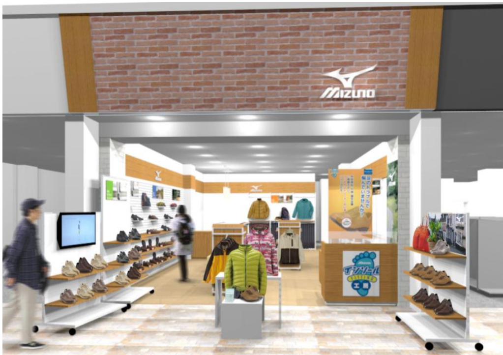
「ミズノウエルネスショップ佐世保」※画像はイメージです。

「ミズノウエルネスショップ」は、2006年に第一号店を大阪の『なんばウォーク』内にオープンしました。ウォーキング品、アウトドア品など拡大傾向にある健康スポーツ品や、肌着などの日用品に特化した専門店として、現在全国で12店舗を展開しています。