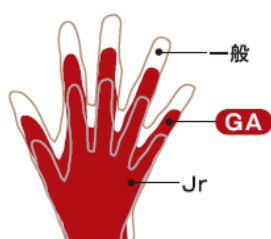
内部手袋の大きさ比較

グラブ内部の手袋の大きさを、この世代にフィットするよう少年用と一般用の中間サイズにし、指を入れる部分の幅も一般用より細い設計にしています。一方で、グラブ自体の長さは一般用グラブと同水準にすることで、操作性を高めつつ、より広範囲の打球に対応できるようになっています。