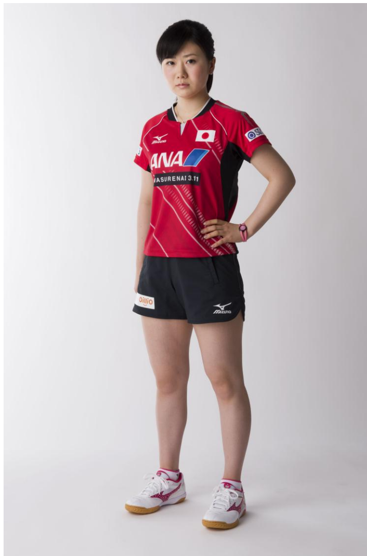
卓球日本代表 オフィシャルユニフォーム

世界卓球選手権が行われる蘇州に向けて、飛行機が走行する明るく照らされた滑走路をウェア前面に表現。カラーには“光”、“輝き”をイメージしたライムグリーン、ベリーピンク、そして、日の丸をイメージしたレッドの3タイプを用意しました。