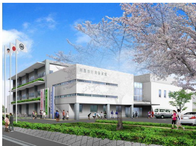
「川西市市民体育館」 ※写真はイメージです。

今後は、川西市のキャラクター「きんたくん」を活用した会員制組織「きんたくんクラブ」を設置し、一人一人にあった運動プログラムを提供します。また、現役のトップアスリートや、かつて第一線で活躍したアスリートによる専門的な実技指導を行う「ミズノビクトリークリニック」の開催も予定しています。