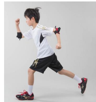
<肘を曲げ、前後に大きく腕が振れている>