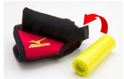
<左：本体、右：サウンドシリンダー>

本体の肘外側に、筒状の「サウンドシリンダー」を内蔵（左右）、前後に腕を振ることでシリンダー内のステンレス球が移動しカチャカチャという心地良い音が鳴ります。正しく腕を振れば大きくリズムカルな音になり、自分で腕振りの状態が分かるため、音を大きく鳴らそうとしているうちに自然と腕振りが身につきます。