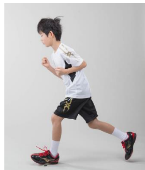
<腕が大きく振れていない>